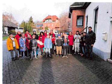
Kooperation mit IGS Schöppenstedt – Backen für die Tafel