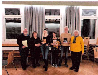
Lesung mit Musik