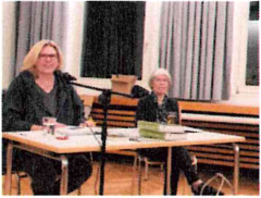
Lesung Grenzschicksale mit Zeitzeugen