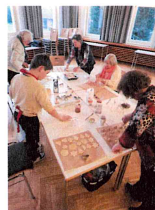
Plätzchen backen für Jung und Alt