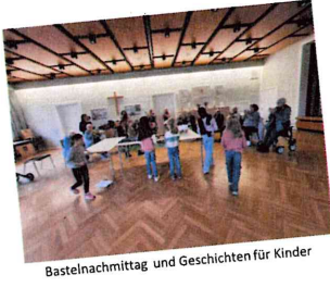
Bastelnachmittag und Geschichten für Kinder