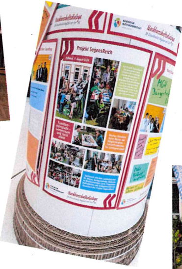
Ausstellung im Landtag Hannover