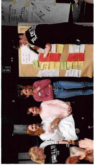
Gut 70 Jugendliche haben über die Themen diskutiert, die ihnen in Wolfenbüttel am Herzen liegen.