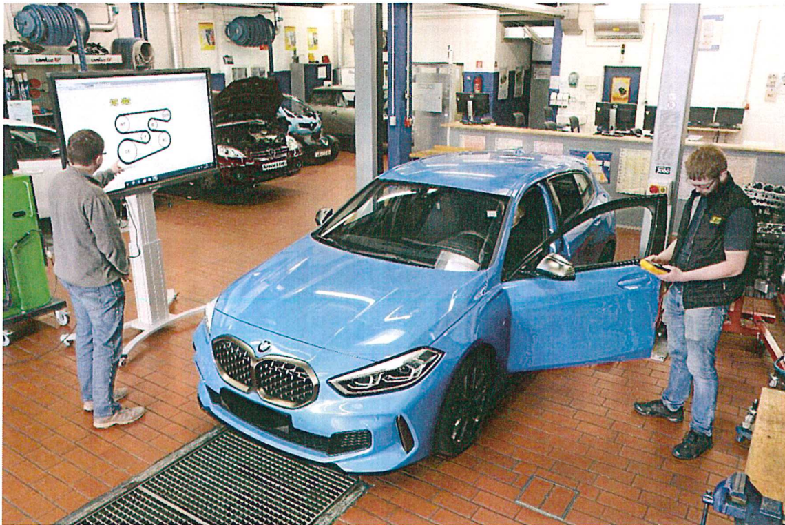
Die Kfz-Werkstatt mit verschiedenen Lernträgern (hier ein BMW M135i xDrive)

Auch in Sachen Schul-IT besteht eine exzellente Zusammenarbeit mit dem Schulträger, und zwar nicht nur bei der sehr guten Ausstattung, sondern auch bei der didaktisch-methodischen Unterstützung unserer Lehrkräfte durch eine Landkreismitarbeiterin für Medienpädagogik Schule .