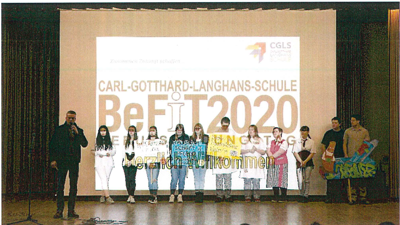
Begrüßung der Gäste am Berufsfindungstag 2020

Auch für Schülerinnen und Schüler unserer Partnerschulen bieten wir regelmäßig Angebote zur Berufsorientierung. Zurzeit werden diese Angebote von sieben Schulen in Stadt und Landkreis Wolfenbüttel wahrgenommen.