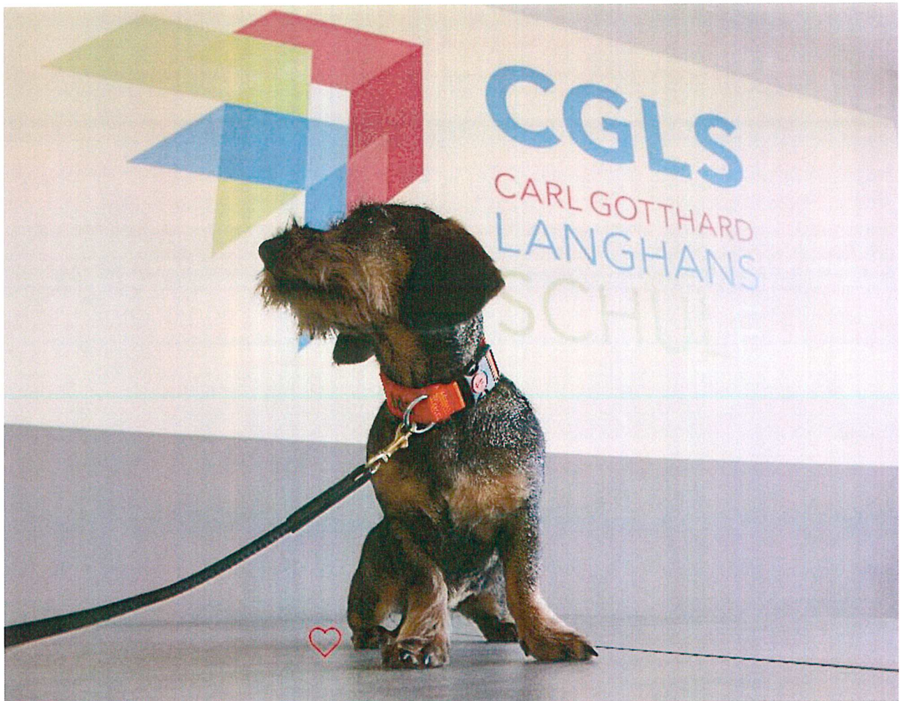
Unsere Schulhündin Ida

Unser Schulsanitätsdienst kümmert sich um leichte Verletzungen oder Unwohlsein im Schulalltag.