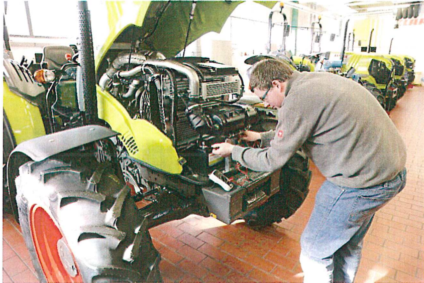
Die Werkstatt für Landmaschinenmechatronik

Sonstige Angebote , wie kostenloser Förderunterricht in Deutsch und Mathematik sowie unsere Initiative „Schüler helfen Schülern“, runden unser Bildungsangebot ab.