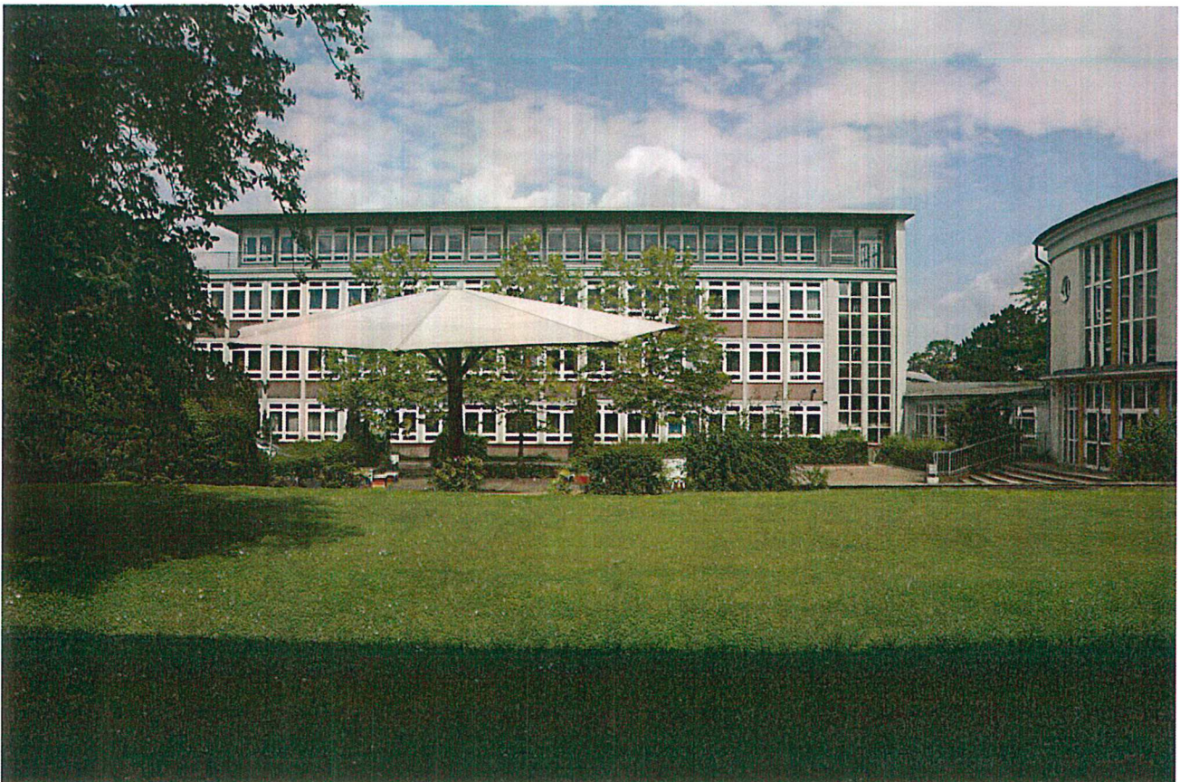
Rückansicht des Gebäudeteils D der Abteilung Technik

Sonstige Angebote , wie kostenloser Förderunterricht in Deutsch und Mathematik sowie unsere Initiative „Schüler helfen Schülern“, runden unser Bildungsangebot ab.